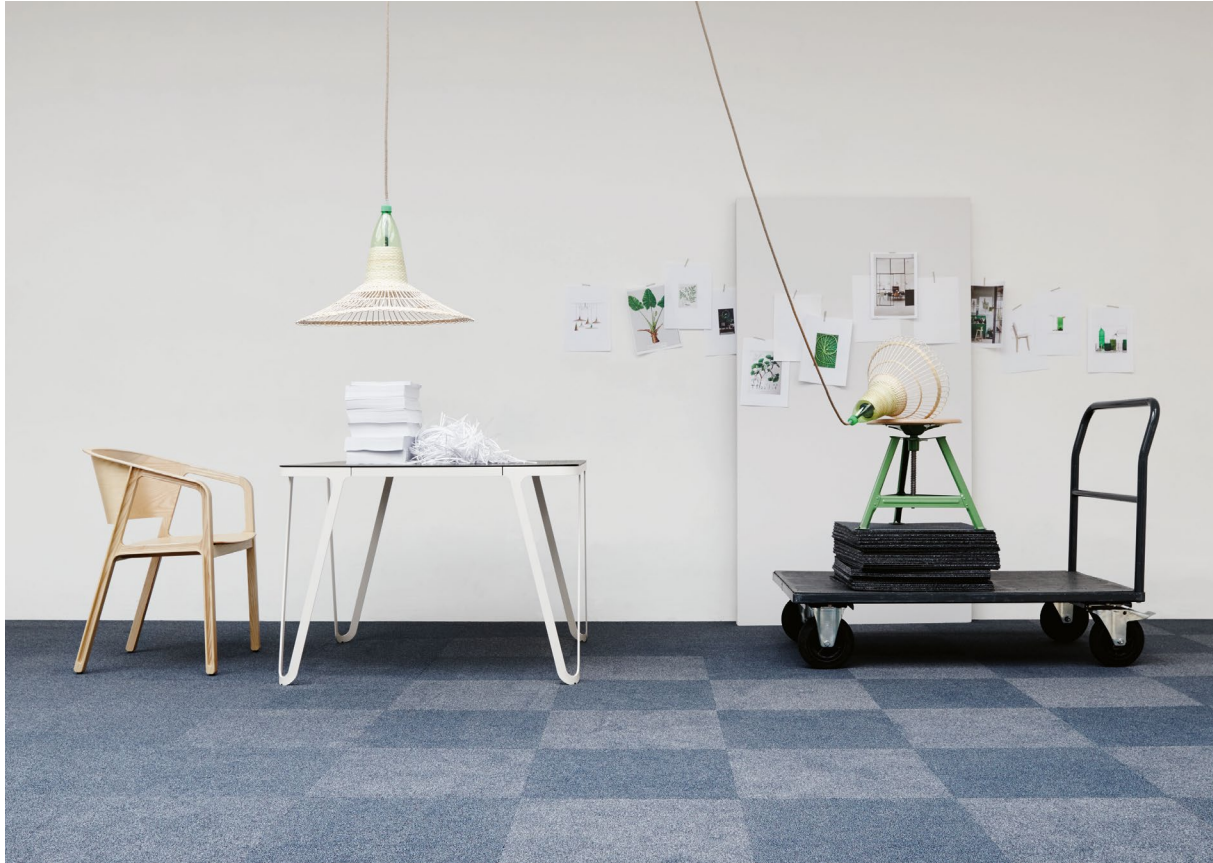
OBJECT CARPET Greencard-Serie

Für die 2024 auf den Markt gebrachten DUO-Fliesen seiner Greencard-Kollektion – NYLTECC, NYLLOOP und SPRINGLES ECO – hat OBJECT CARPET das offizielle Material Health Statement® (MHS) der EPEA erhalten. Dadurch wird nicht nur das zukunftsweisende Design und die konsequente Kreislauffähigkeit der Kollektion bezeugt, sondern auch ein außergewöhnlich hohes Maß an Transparenz garantiert.