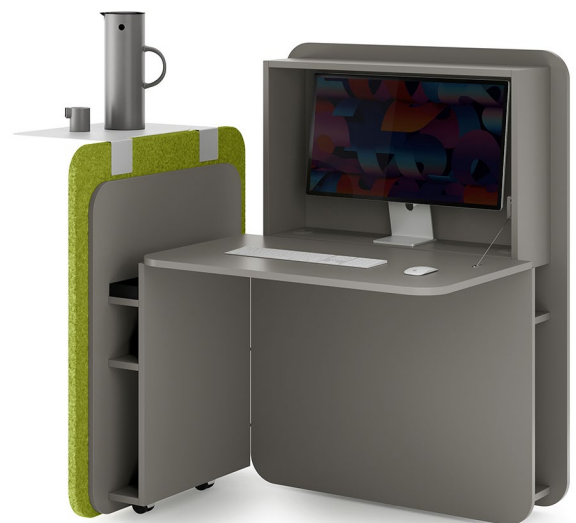
Mobiler Arbeitsplatz FLATup