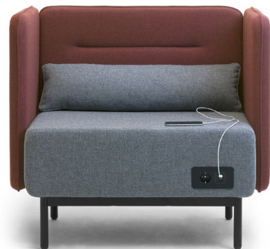
Serie CALESITA DIALOG