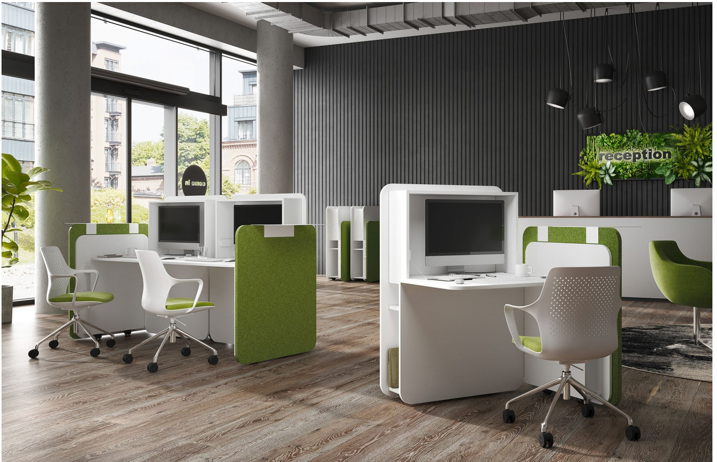
Mobile Arbeitsplätze FLATup