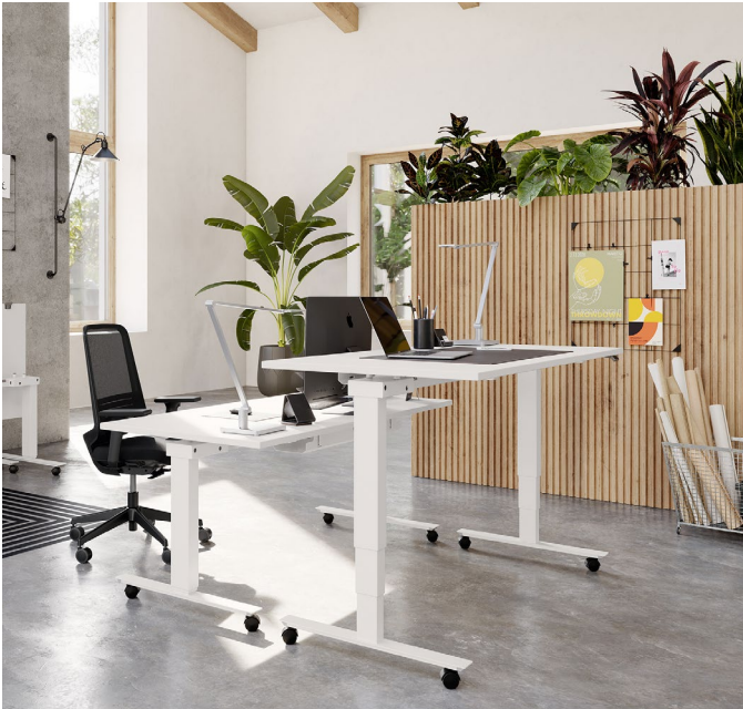
Mobiler Sitz-Steh-Klapptisch Topspin