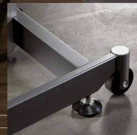
Verstellgleiter/Rollen Patins réglables/roulettes