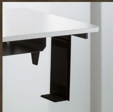
PC-Halter Support PC