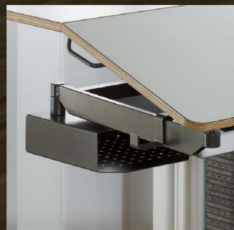
Zusatzfächer Bac de rangement supplémentaire