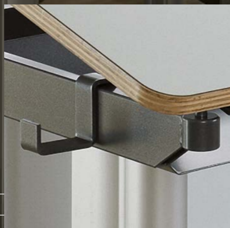
Mappenhaken Crochet à mallettes