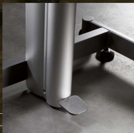
Fusspedal Pédale de réglage