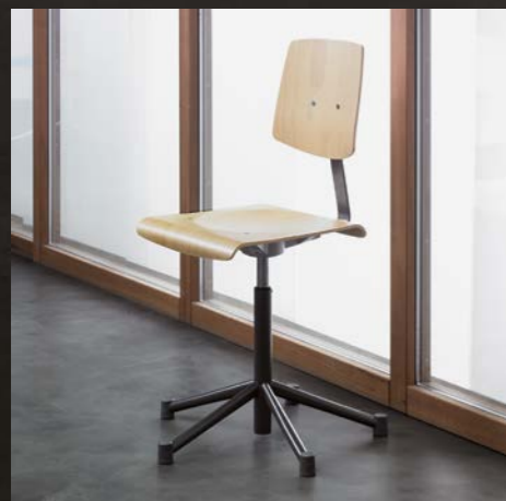
Buche natur Hêtre naturel