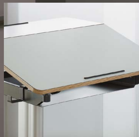
Ablagefach Bac de rangement