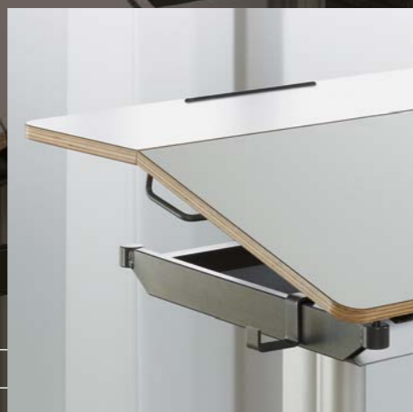
Geteilte neigbare Platte Plateau en deux parties, inclinable