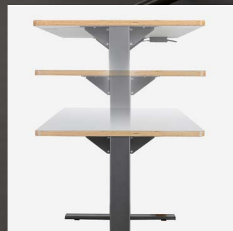
Höhenverstellbar Hauteur réglable

Pour toutes les zones où des tables individuelles ne sont pas l'idéal, p. ex. les salles ACT/ACM ou les salles de groupes, ScuolaBOX propose des tables avec des surfaces plus grandes et avec un réglage à gaz, ce qui permet un travail assis ou debout. Des roulettes intégrées permettent un placement flexible.