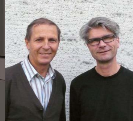
Produktdesign: Ivo Vesely und Roland Eberle

Ein leichter und mobiler Tisch ist das Grundelement des Einrichtungssystems ScuolaBOX. Zusammen mit dem Stuhl ScuolaFLEX lassen sich zukunftsorientierte Bildungsräume mit unterschiedlichen Anforderungen flexibel und ergonomisch realisieren.