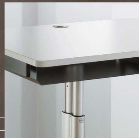
Kabeldurchlass Passage des câbles