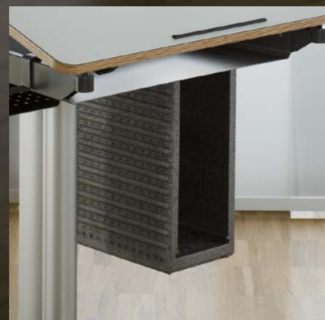
Mobile Ablagebox Box de rangement mobile