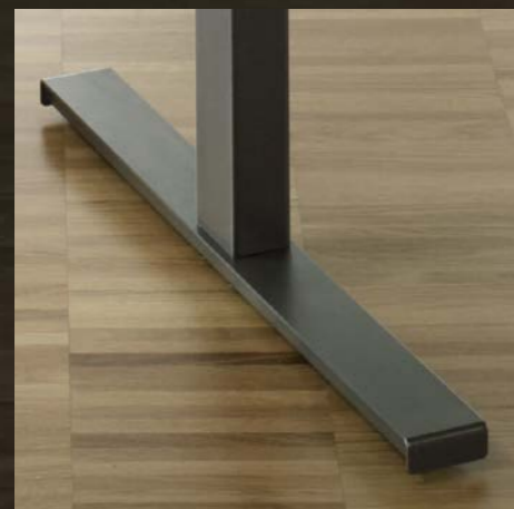
Verstellgleiter/Rollen Patins réglables/roulettes

L'enseignante et l'enseignant deviennent de plus en plus des entraîneurs de la classe. La table de professeur lourde et imposante est remplacé par une place de travail accueillante et flexible.