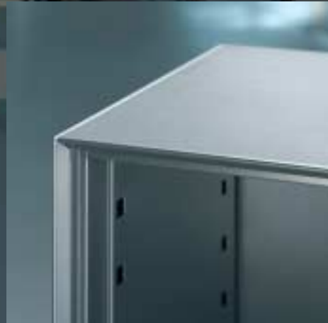
Decke Stahl Plateau de finition en acier Cover steel