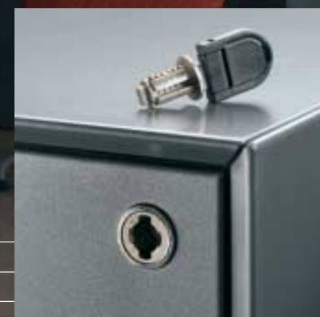
Wechselzylinder Cylindre interchangeable Exchangeable cylinder