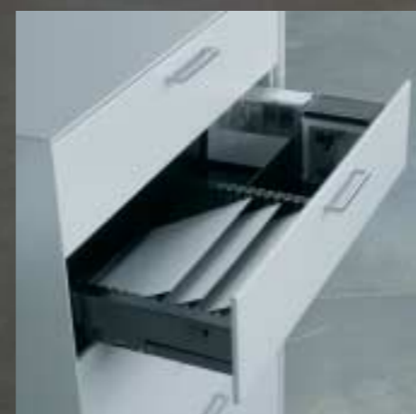
Breitschublade Tiroir à usage multiple Organizable drawer