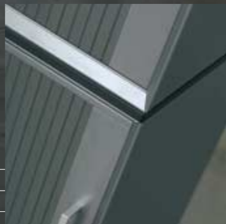
Zwischenplatte Élément intermédiaire Intermediate bottom