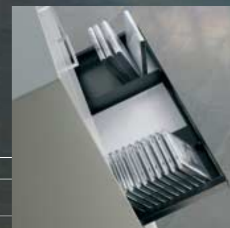
Organisierbare Auszugstablare Petits tiroirs pour des matériaux divers Small drawers, organizable