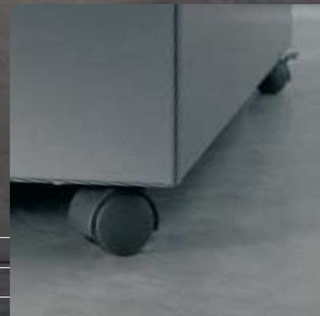
Rollen Roulettes Rolls