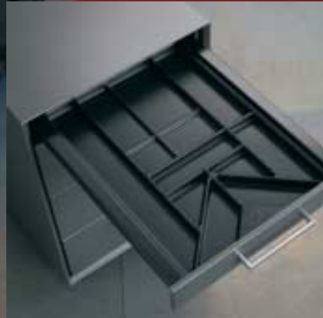
Materialschublade Tiroir pour petit matériel Material drawer