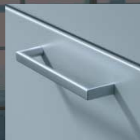
Griff Poignée Handle