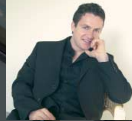
Produktdesign: Bernhard Sievi

BASIC präsentiert sich als schlichtes, funktionales Stahlmöbelprogramm. Es besticht durch sein einheitliches, durchgängiges Erscheinungsbild mit eigener Identität. Dank der zurückhaltenden Gestaltung lässt sich BASIC in jedes Umfeld ergänzend integrieren. Die Intramodularität ermöglicht die Integration vieler funktionaler Anforderungen und bietet Lösungen für alle Ablageformen im professionellen Büro. Die Kombination Stahl-Holz sowie das attraktive Farbkonzept bieten dem individuellen Gestaltungswillen grossen Spielraum.