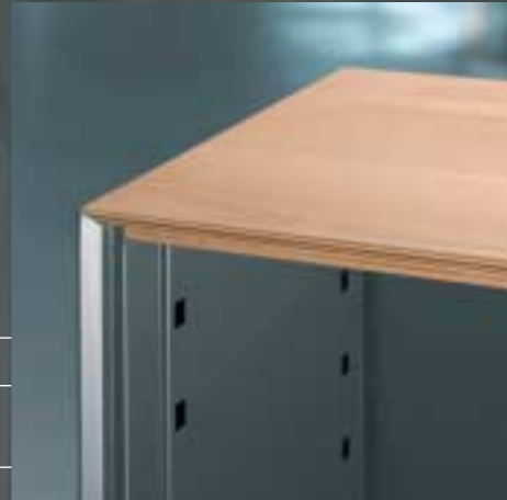
Decke Echtholz Plateau de finition en bois véritable Real wood cover