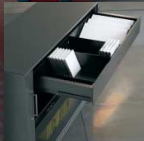
Breitschublade Tiroir à usage multiple Organizable drawer