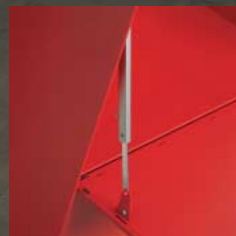
Klappenbeschlag gebremst Porte basculante avec dispositif d'arrêt Lid bracket