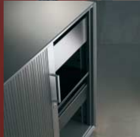
Auszugselemente Éléments d'extension Extractables elements