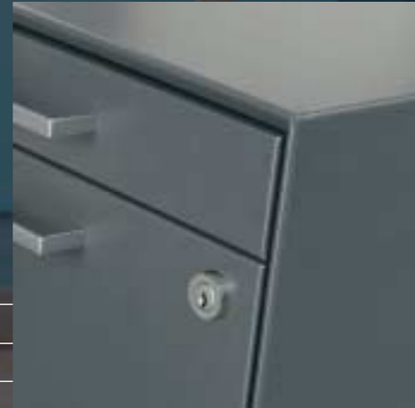
Zentralverschluss Serrure centrale Center closure