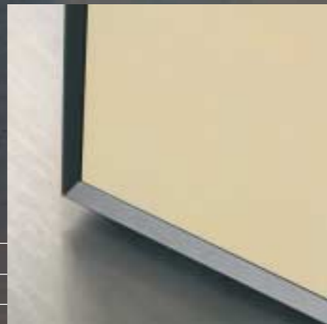
Bodenabschluss Holzfront Finition portes battantes en bois Finish wood front