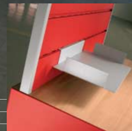
Akustikelement, organisierbar Protection phonique, organisable Noise protection, organizable