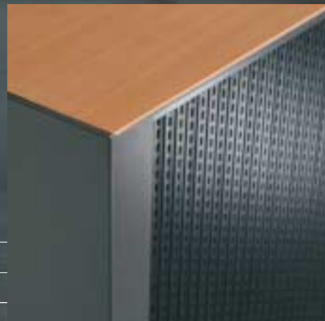
Akustik-Rolladen Rideau acoustique Acoustic shutter