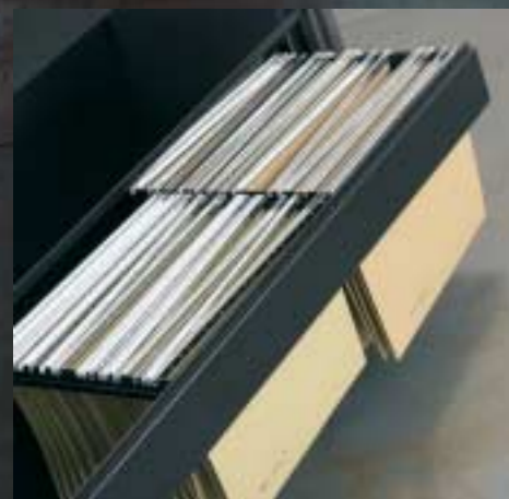
Hängemappen Auszug Extension pour dossier suspendus Sliding frame for suspended files