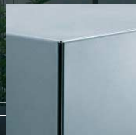
Sichrückwand Panneau arrière Rear panel