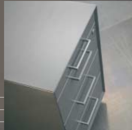
Einteilung 9666 Disposition 9666 Arrangement 9666