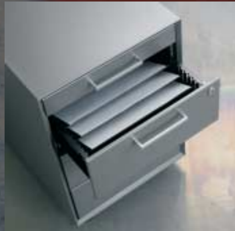
Organisierbare Schubladen Tiroirs subdivisibles Organizable drawers