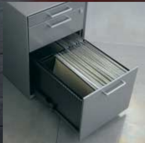
Hängemappen Schublade Tiroir à dossiers suspendus Drawer for suspended files