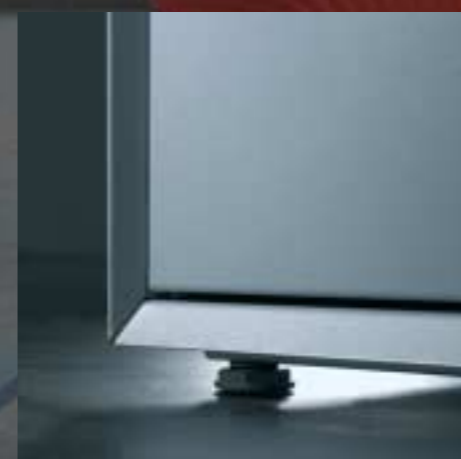
Verstellgleiter Patins de réglage Sliding device