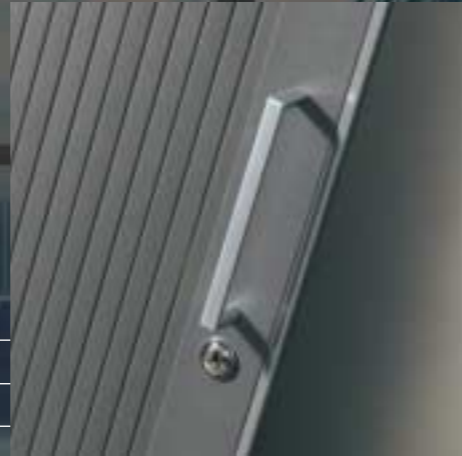
Griff Poignée Handle