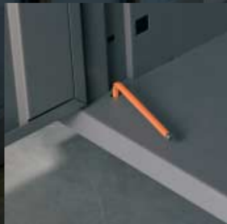
Innenverstellbare Gleiter Patins réglables depuis l'intérieur Inside sliding device