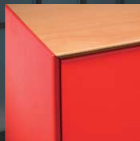
Decke Echtholz Plateau de couverture en bois véritable Top cover wood