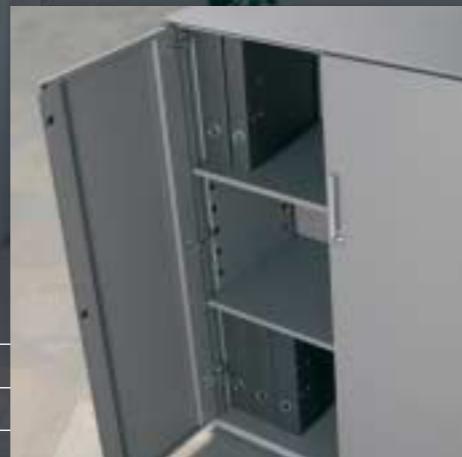
Türen Stahl Portes en acier Doors steel