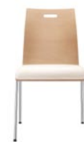
1090 mit Griffloch 5