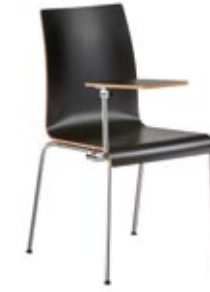
1090 mit Schreib- tablar