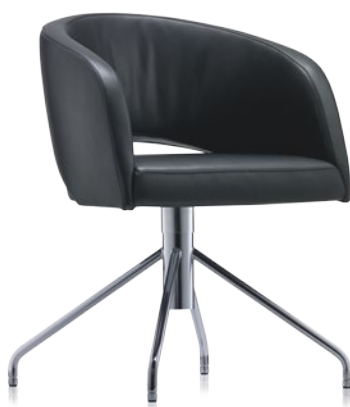
Cosa T-C040 RK