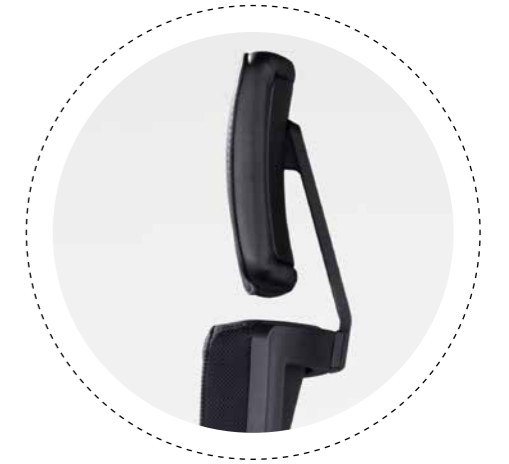
HÖHENVERSTELLBARE KOPFSTÜTZE Zur Entlastung der Schulter- und Nackenmuskulatur

UNSER DREHSTUHL OKAY.II FOLGT DEN INDIVIDUELLEN ANSPRÜCHEN IHRER ARBEITSKULTUR UND SCHAFFT DIE BASIS FÜR KÖRPERGERECHTES SITZEN. DIE ERGONOMISCHE KONTUR DER RÜCKENLEHNE BIETET HIERFÜR EINE PERFEKTE UNTERSTÜTZUNG GERADE IM LENDENWIRBELBEREICH. ZUSÄTZLICH GIBT DIE FAST UNSICHTBAR INTEGRIERTE ASYMMETRISCHE LORDOSENSTÜTZE PUNKTGENAUEN HALT. AUF JEDER SEITE IST SIE – UNABHÄNGIG VONEINANDER – IN HÖHE UND TIEFE VERSTELLBAR UND ENTLASTET DIE BANDSCHEIBE. ES ENTSTEHT EIN ANGENEHMES SITZGEFÜHL, UND SIE KÖNNEN IHR POTENZIAL JEDEN TAG AUSSCHÖPFEN.