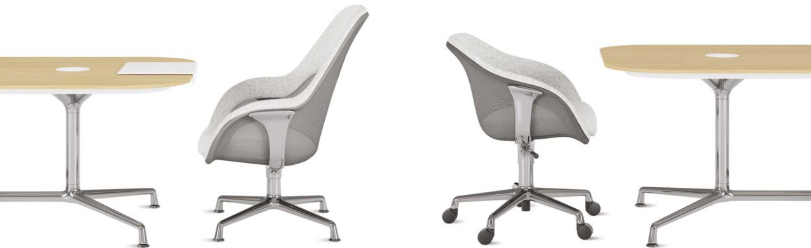
Teamwork-Höhe (H 660 mm)