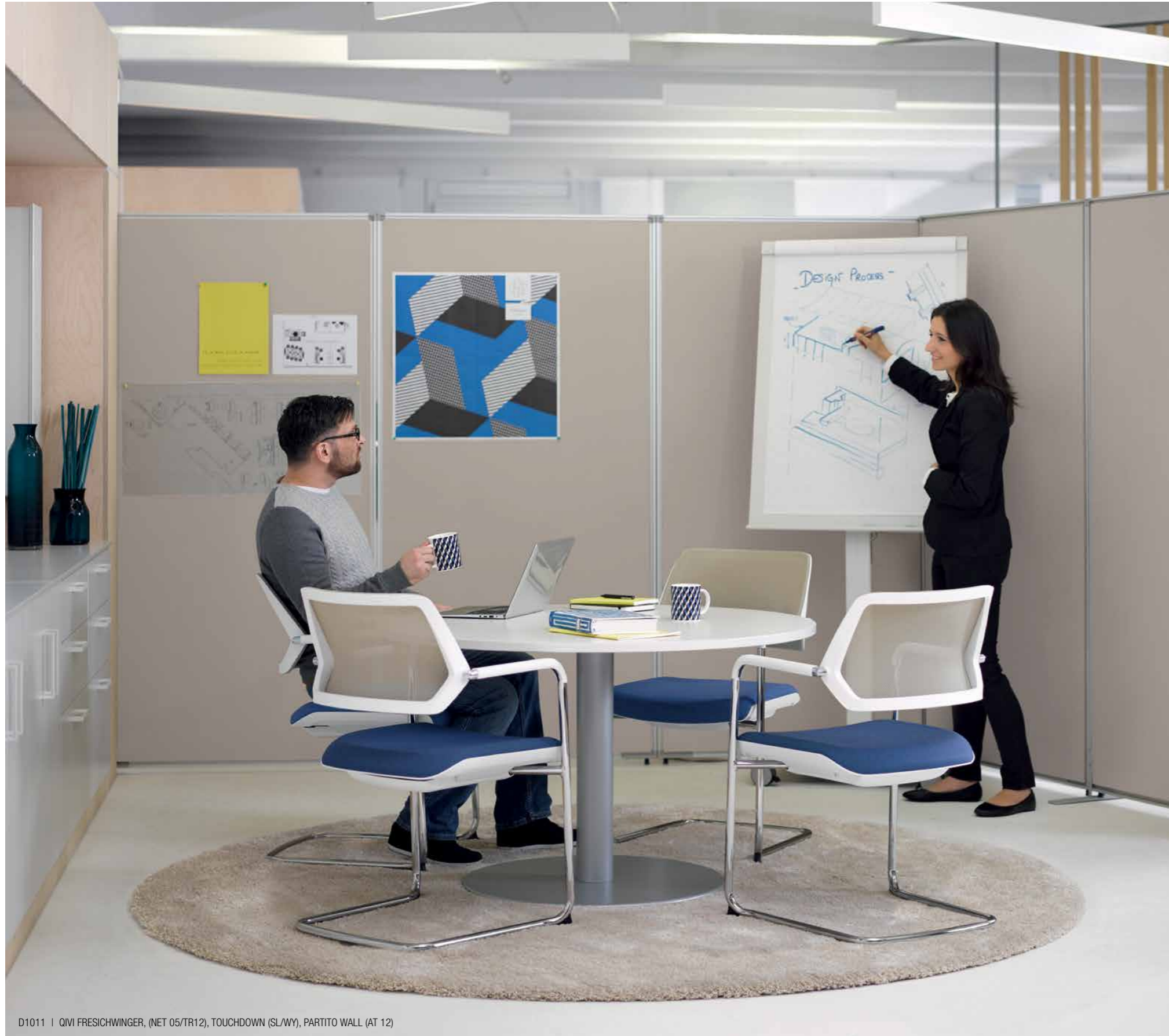
D1011 | QIVI FRESICHWINGER, (NET 05/TR12), TOUCHDOWN (SL/WY), PARTITO WALL (AT 12)