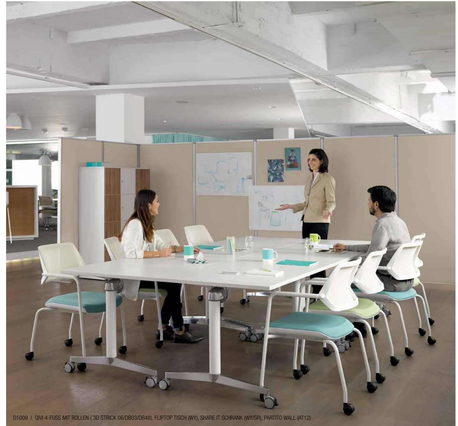
D1009 | QIVI 4-FUSS MIT ROLLEN (3D STRICK 06/DB03/DB48), FLIPTOP TISCH (WY), SHARE IT SCHRANK (WY/SR), PARTITO WALL (AT12)

Qivi ist der ideale Teamstuhl für alle Arten der Teamarbeit und kann maßgeblich dazu beitragen, Meetings produktiver zu gestalten – egal, ob sie nun in informellen Teambereichen, klassischen Besprechungsräumen oder Konferenzräumen stattfinden.