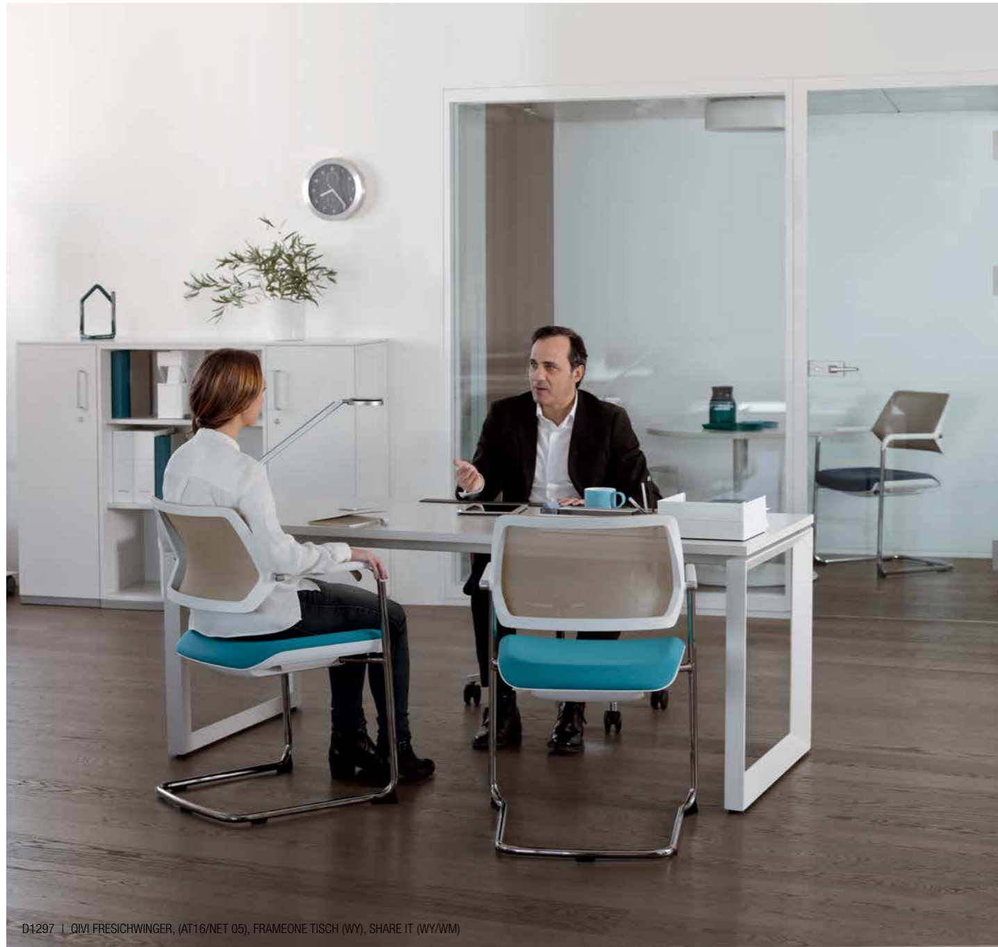
D1297 | QIVI FRESICHWINGER, (AT16/NET 05), FRAMEONE TISCH (WY), SHARE IT (WY/WM)