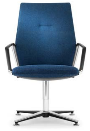
Konferenzdrehstuhl Siège de conférence pivotant