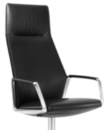
_3 Armlehnen Auflage Leder Accoudoirs, manchettes en cuir