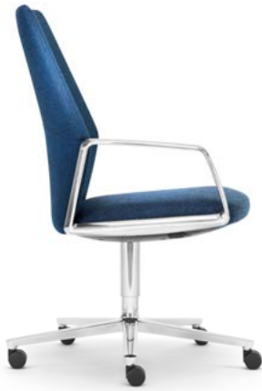
Drehstuhl Siège de bureau