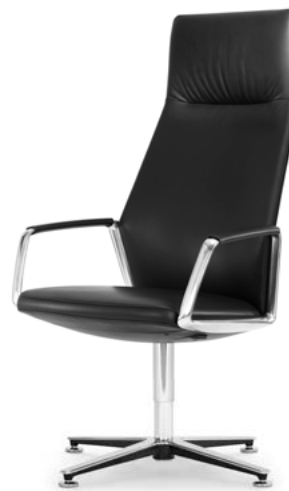
Konferenzdrehstuhl hoch Siège de conférence pivotant haut

Eyla ist ein besonders komfortabler Sessel für den gehobenen Konferenzbereich. Die aufwendige Polsterung verbirgt im Sitz einen innovativen Bewegungsmechanismus. Dieser ermöglicht komfortables Zurücklehnen indem der Sitz nach vorne gleitet und der Rücken geneigt wird. Die Federkraft stellt sich dabei automatisch auf das Gewicht des Benutzers ein.