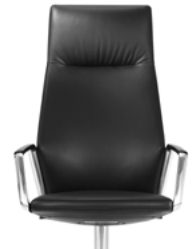
_2 Rücken Polster Hoch Dossier haut rembourré