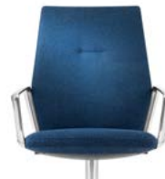
_1 Rücken Polster Standard Dossier standard rembourré