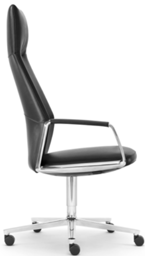
Drehstuhl hoch Siège de bureau haut