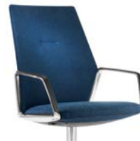
_2 Armlehnen Auflage Kunststoff Accoudoirs, manchettes en matière synthétique