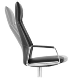
_1 Neigemechanik Mécanisme d'inclinaison