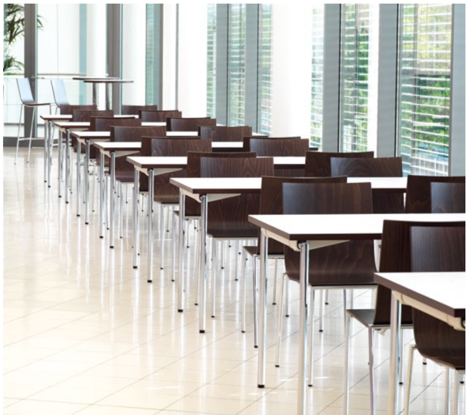
SMA Solar Technology AG, Niestetal