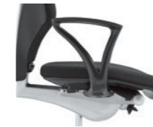
Fixe Armlehnen ungepolstert Accoudoirs fixes, non rembourrés

Toutes les possibilités de configuration vous sont proposées par le configurateur en ligne sur le site www.giroflex.com