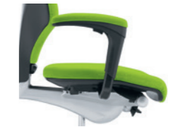
1D-Armlehnen* gepolstert Accoudoirs 1D* rembourrés