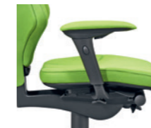
4D-Armlehnen* gepolstert Accoudoirs 4D* rembourrés

* 1D = höhenverstellbar réglable en hauteur 4D = höhen-, breiten- und tiefenverstellbar réglable en hauteur, en largeur et en profondeur