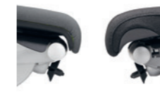
Standardpolster (links) Komfortpolster (rechts) Rembourrage standard (à gauche), rembourrage confort (à droite)