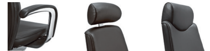
Armlehnen gepolstert Accoudoirs, rembourrés