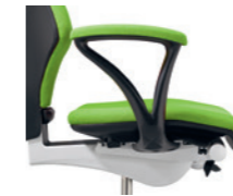
Fixe Armlehnen gepolstert Accoudoirs fixes rembourrés