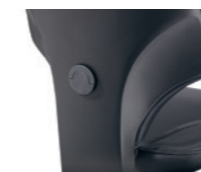
Tiefenverstellbare Lordosenstütze Soutien lombaire réglable en profondeur

* 1D = höhenverstellbar réglable en hauteur 4D = höhen-, breiten- und tiefenverstellbar réglable en hauteur, en largeur et en profondeur