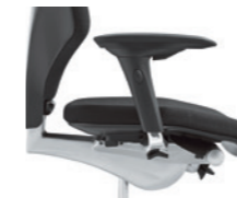
4D-Armlehnen* ungepolstert Accoudoirs 4D* non rembourrés