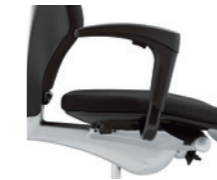
1D-Armlehnen* ungepolstert Accoudoirs 1D* non rembourrés