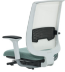
Möwengrau / Reply Air