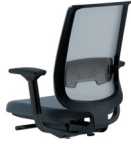
Schwarz / Reply Air