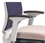
Armlehnen (unverstellbar, 1D, 3D, 4D, ohne)