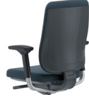
Schwarz / Reply