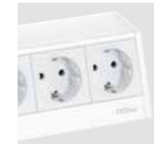
Weiß weiße Module