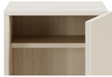
Anpassbarer Einlegeboden** (für Schließfacheinheiten mit 400mm oder mehr)