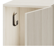
Kleider/Taschenhaken** (für Schließfacheinheiten mit 750mm oder mehr)