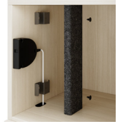
Vertikales Kabelmanagement für vernetzte Kabelschlösser

**Optionen nur für Schränke mit Türen erhältlich.