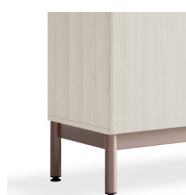
220mm Rahmengestell mit Kabelsammler***

***Kompatibel mit kabelgebundenen vernetzten Schlössern.