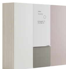
Whiteboard*, Melamin, Stoff