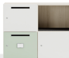
Briefschlitz, Namensschild, PET Inlay (für offene Fächer)