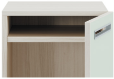
Fester Einlegeboden** (für Schließfacheinheiten mit 400mm oder mehr)