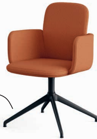
Alu-Vierfuß schwarz matt Piétement 4 branches, noir mat