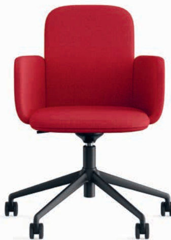
Konferenz Partner Siège conférence