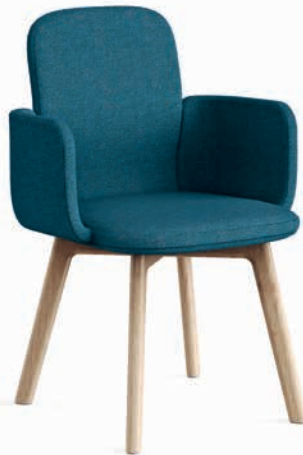
Massive Eiche Chêne massif