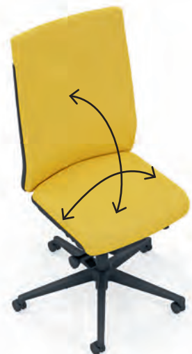
F1 Synchron-Mechanik Mécanisme synchrone