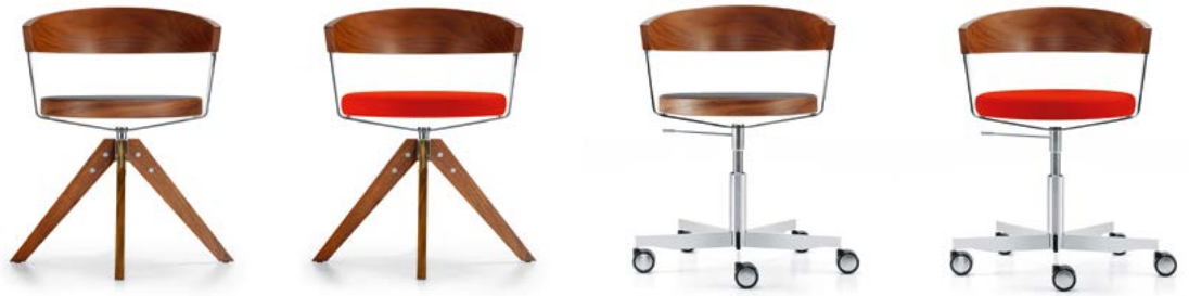
Drehstuhl mit Viersternfuss in Holz Siège de bureau avec piétement quatre branches en bois