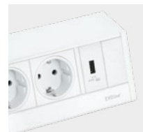
Weiß / weiß White / white