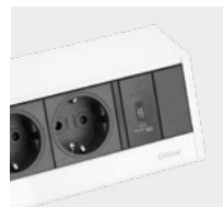
Weiß / schwarz White / black