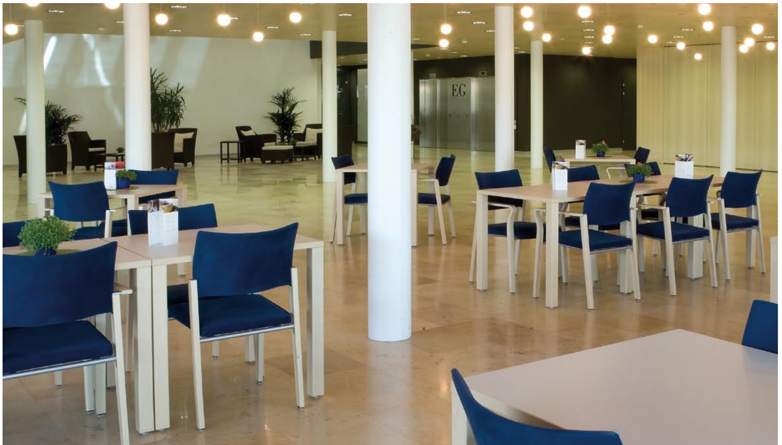
Pflegezentrum | Baar Centre de soins | Baar