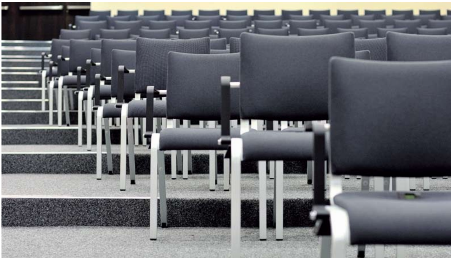
Kongresshaus Casino Kursaal | Interlaken